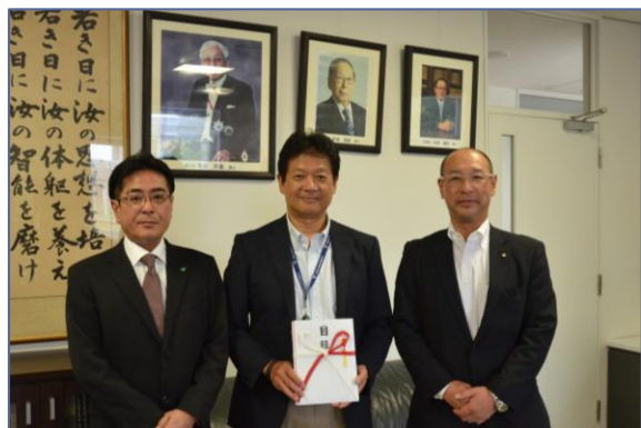
学校創設者の写真の前にて