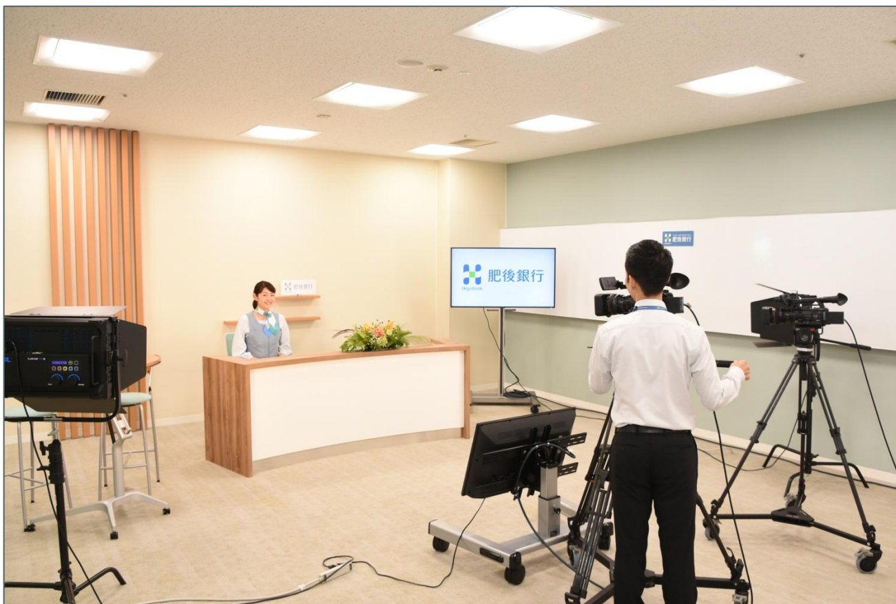
Weekly ニュース収録風景