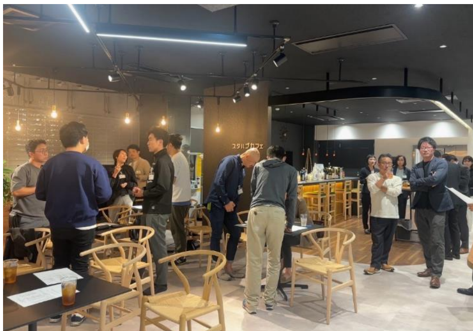
2024.10 月 介護・福祉関連事業者さま向け スタバブくまもと開業者セミナー