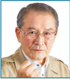
竹崎 一成 町長

芦北町では「すべては次代を担う子どもたちのために」という基本理念の下、様々な施策に取り組んでいます。令和2年7月豪雨では甚大な被害が発生しました。ふるさとの皆様が安全・安心に暮らせるよう災害からの復旧・復興を早急に進めていく事はもちろん、「新しい日常」を築き、輝きを取り戻す「創造的復興」を実現するため、町一丸となって取り組んでいます。なりわい再建、誘致企業との連携、芦北高校の支援などの施策を進め、次世代につなぐために、より一層個性が光る魅力と活力あふれるまちを目指します。