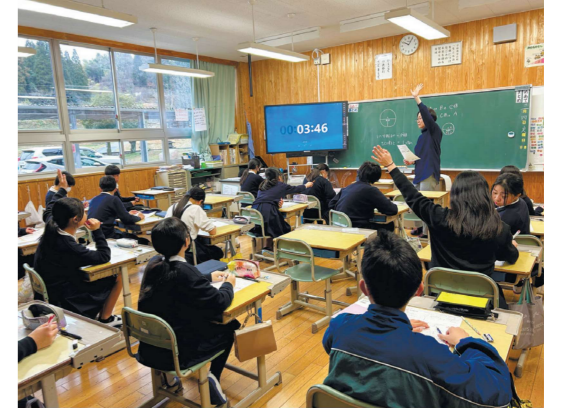
学校での授業の様子

このような課題を解決するために、「和水町子育て応援プラン」をスタートし、入学祝金の支給、学校給食費及び保育所等副食費の無償化、教育環境の整備など、子どもの成長段階に合わせた切れ目ない子育て支援策を実施していくことで、『ここで育ててよかった』と思っていただくことのできる町を目指しています。