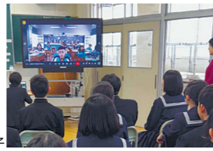
オンライン交流の様子

現地の児童生徒とのオンライン交流や、中学生を台湾に派遣する短期派遣事業を行うなど、子どもたちが国際感覚を育み、世界で活躍できるよう、人材育成に取り組んでいます。