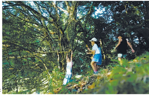
江田船山古墳で遊ぶ様子

令和5年度から「出生祝金」を拡充し「入学祝金」を支給することで、移住・定住の促進につなげるとともに、子育て世帯の経済的負担の軽減を図っています。