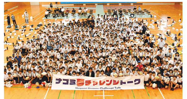
ナゴミ夢チャレンジトークの様子

町内の小学生・中学生が将来に夢を持ち、チャレンジ精神を醸成するきっかけとするため、一流のアスリートや文化人を招き、講演会を実施しています。