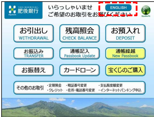
①〔取引選択画面（ENGLISH キー選択）〕