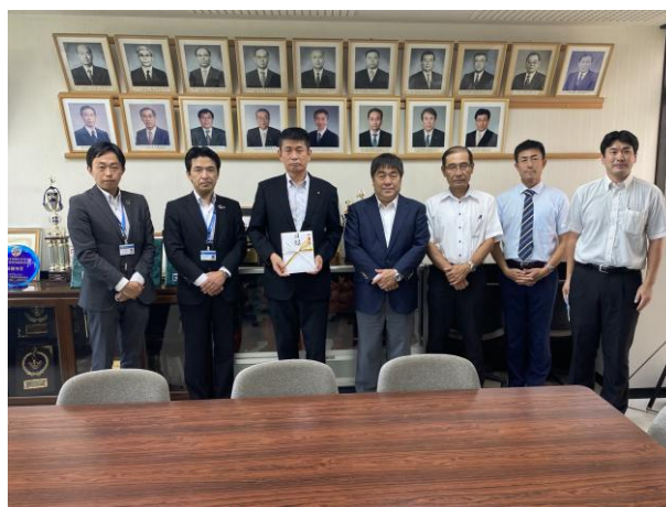
記全員で写真撮影

《本件に関するお問い合わせ》 肥後銀行 法人営業部 担当：雨宮 電話 096-326-8602