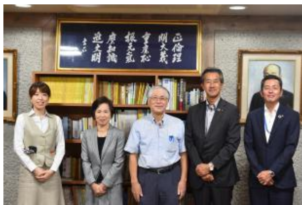
記念品を前に全員で記念写真撮影

《本件に関するお問い合わせ》 肥後銀行 コンサルティング営業部 担当：林 電話 096-326-8602