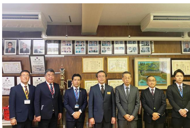
全員で記念写真撮影