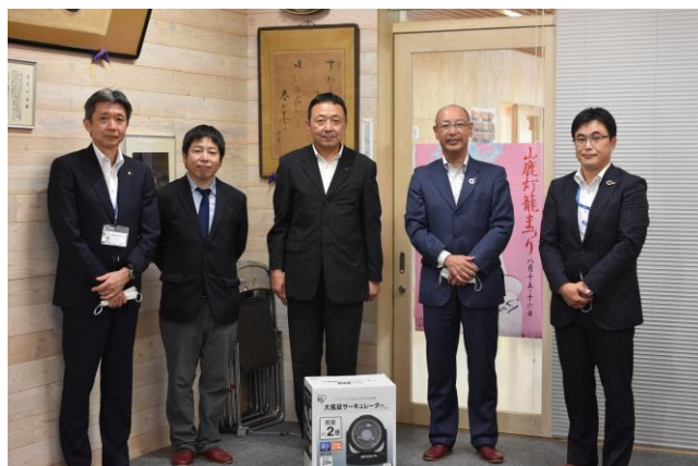
寄贈品を前に全員で記念写真撮影